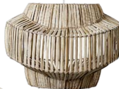
Beeindruckend XL-Hängelampe aus geflochtenem Holz. Von Manor. ► CHF 99.-

Natürlich XL-Holzarmreif von Piazza Sempione. Grieder, Ciolina, Bern. www.piazzasempione.com ► CHF 242.-