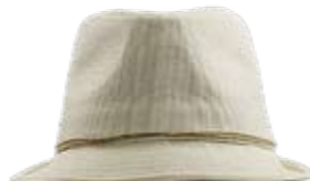
Klassisch Weisser Trilby von Nulu bei Coop City. Auch in Schwarz erhältlich. Solange Vorrat. ► CHF 24.90