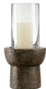
Archaisch Zweiteiliges Windlicht aus recyceltem thailändischem Rotholz. Globus. ► CHF 99.-